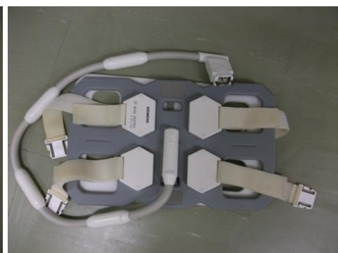
写真3（腹部用コイル）