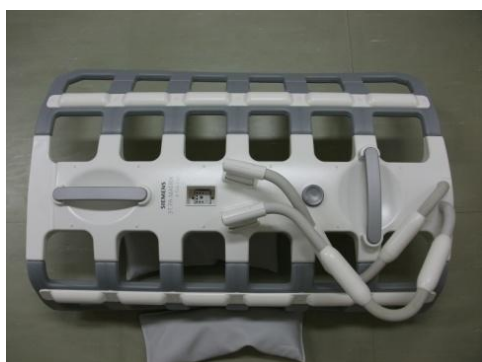
写真4（下肢用コイル）