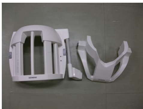
写真2（頭部コイル 頸部コイル）