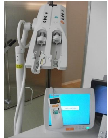
写真7 (造影剤自動注入器)

このように、検査部位に適したコイルを使用して、撮影します。3Tの特徴上、非常に高い信号が得られますので、より精密な画像を作ることが出来ます。